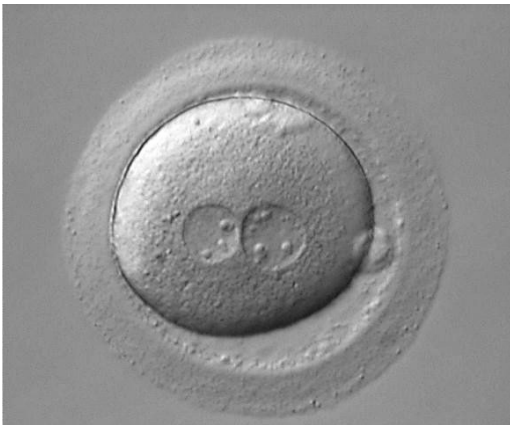
Abb. 1.2: Modernes Foto einer Zygote, der Vereinigung vom väterlichen und mütterlichen Erbgut