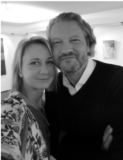
Abb. 1.4: Ein modernes Paar