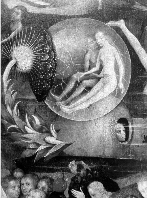
Abb. 1.1: Mann und Frau: Der Ursprung allen menschlichen Lebens. Ausschnitt aus dem Garten der Lüste von Hieronymus Bosch (1490/1500)